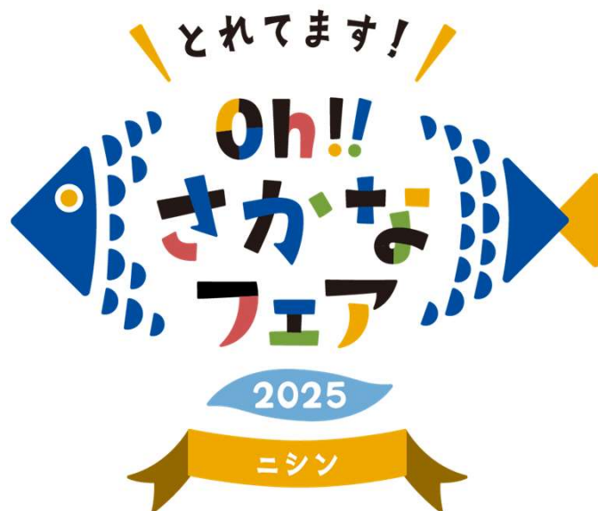
ニシンフェア参加用（横）